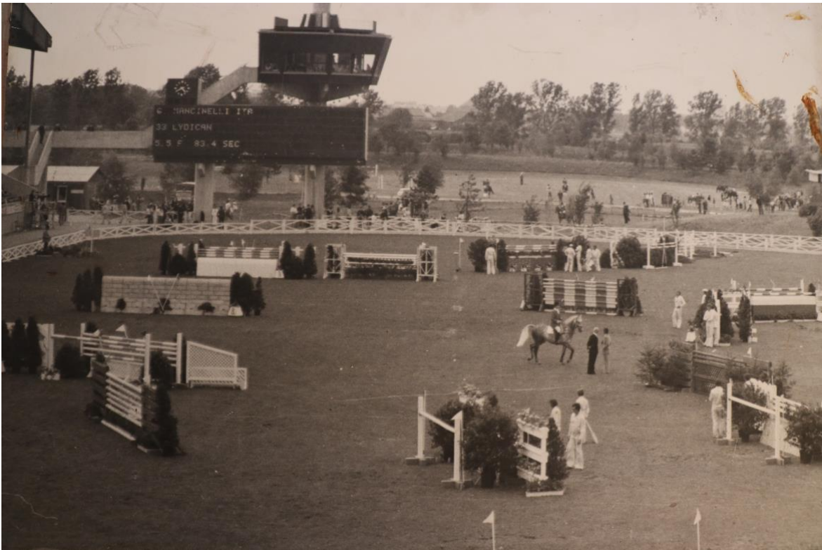
Das Olympia-Reitstadion zu den Olympischen Spielen 1972.

Direkt vor den Toren Münchens liegt eine der schönsten Reitanlagen der Welt, die im letzten Jahr ihr 50-jähriges Bestehen feiern durfte. Lebendige Pferdesportgeschichte, die mit der Sommerolympiade 1972 begonnen hat. Bis heute existieren die unzähligen Stallungen, großzügigen Bauten, unterschiedlichsten Reitplätze und ein Teil des ehemaligen Reitstadions, das immer noch als beliebter Austragungsort für Pferdesportveranstaltungen genutzt wird. Umsäumt wird das Areal von einem über die Jahrzehnte gewachsenen Baumbestand, der einem englischen Park doch sehr nahe kommt.