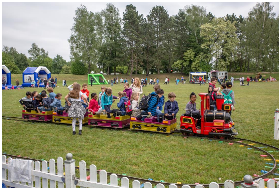
Über die Kindereisenbahn dürfen sich die Jüngsten freuen- hier auf Pferd International München im Kinderland.

Um den Tag perfekt zu machen, lädt das Kinderschminken zu fantasievollen Gesichtsverzierungen ein.