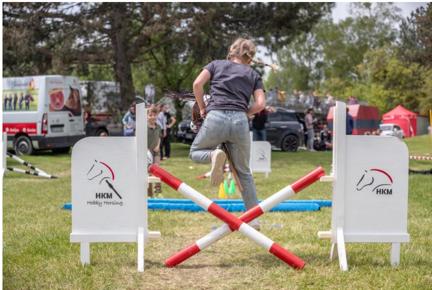
Hobby Horsing präsentiert von HKM Kids im Kinderland der DJM.

Und während die Erwachsenen durch die Ausstellung schlendern, wird für die Kids am Wochenende ein buntes Programm im Kinderland, präsentiert von Schumacher Packaging GmbH, geboten. Tatkräftige Unterstützung gibt es dabei vom FN-Jugendteam, das vom Förderkreis des Reitsports in Bayern e.V., kurz FRB e.V., gesponsert wird. Hier ist für jeden etwas dabei. Wie es sich anfühlt auf dem Pferderücken können die Jüngsten beim Ponyreiten des Matthofs ausprobieren. Die Ponys des Matthofs sind bestens ausgebildet durch ihren Job in der Reitschule. Mit ihrem lieben Wesen lassen sie die Augen der Kinder strahlen.